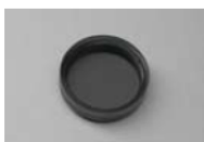
拡散フィルター(オプション)