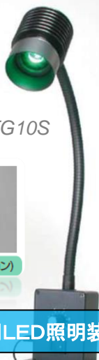
目視検査用LED照明装置 インспекションライト