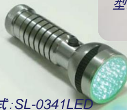
粉塵探査用ハンディ・インспекションライト