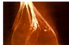
さらにその1本は、1,056本の収束体からできています