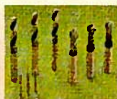
●使用済ドリル・エンドミル類